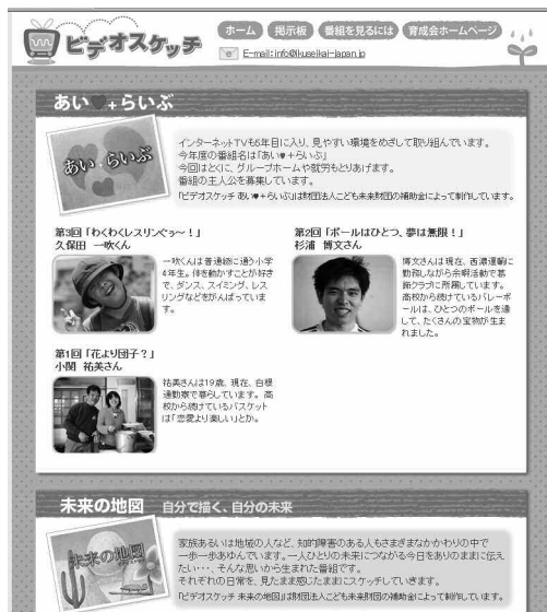
(ウェブ：ビデオスケッチページ)

http://www.ikuseikai-japan.jp/videosketch/index.html