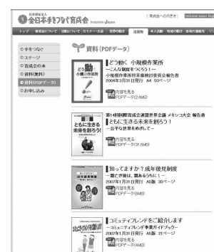
(ウェブ：資料ページ)

【別記】資料の情報は以下から見るができます。 (写真A) 機関誌「手をつなぐ」 http://www.ikuseikai-japan.jp/books/books04.html